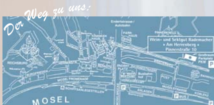
Der Weg zu uns: